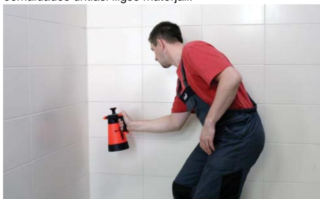
Värskest täidetud vuuqi niisutamine seebiveelahusega

Viie minuti jooksul tuleb täidetud pinnale pritsida seebiveelahust ja siluda pinda niisutatud töövahendiga, eemaldades ühtlasi liigse materjali.